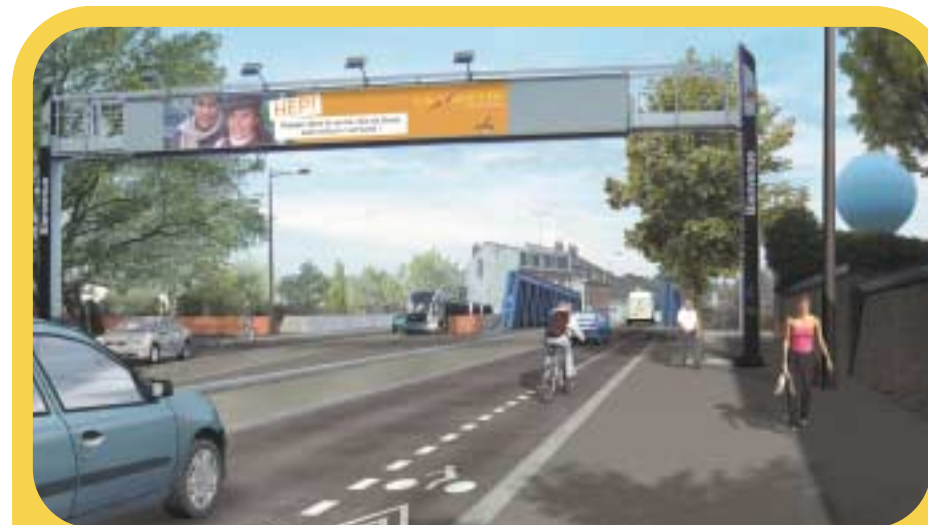
1) PONT DE VALENCIENNES

...ET FIN 2007, NOUS AURONS UN TRAM TOUT NEUF, PERFORMANT ET TRÈS PRATIQUE POUR SE DÉPLACER TOUT EN RESPECTANT L'ENVIRONNEMENT.