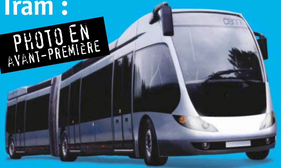
PHOTO EN AVANT-PRÉMIÈRE