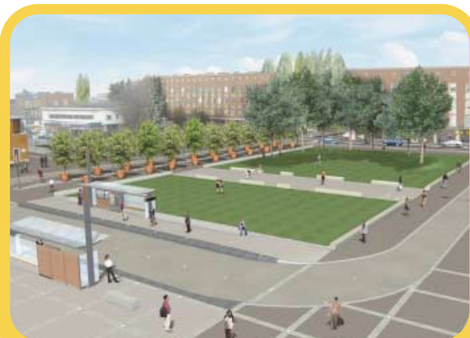
4) GARE DE DOUAI.

Démarrage le 18 septembre 2005. Fin des travaux prévue février 2006.